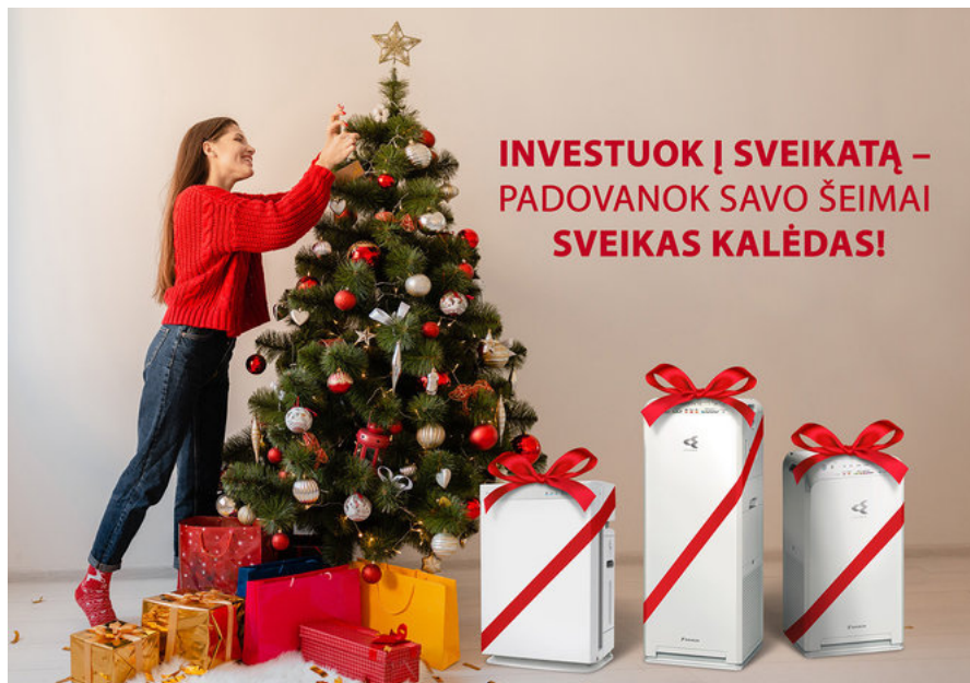
„DAIKIN“ oro valytuvas