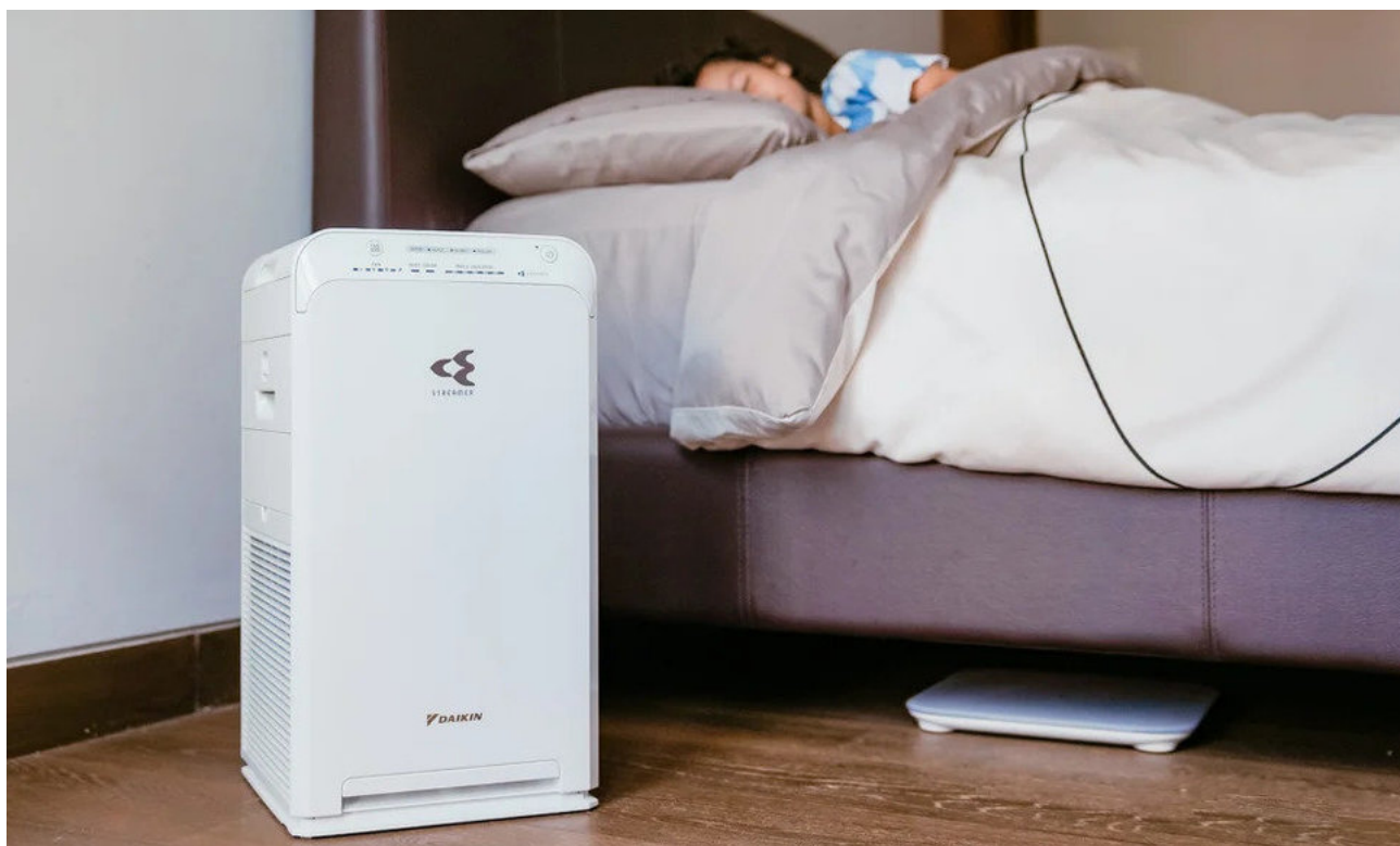
„DAIKIN“ oro valytuvai

Atšalus orams, dėl šildomų patalpų prastesnio vėdinimo bei išsausėjusio oro, jose padidėja kenksmingų medžiagų. Tinkamas mikroklimatas – vienas esminių aspektų, leidžiančių mums patalpoje jaustis patogiai. Oro kokybė – ir temperatūra, ir drėgmė bei užterštumas – visa tai mūsų kasdienybė. Tyrimai rodo, kad patalpų oras yra net kelis kartus labiau užterštas nei lauko, o mes didžiąją dalį laiko praleidžiame patalpų viduje.