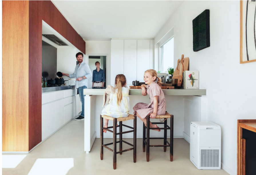
„DAIKIN“ oro valytuvai

lygindami sistemas būtina patikrinkite jų decibelais matuojamą (dBA) triukšmo lygį. Perskaitykite straipsnį „Kaip sumažinti triukšmo taršą namuose“ ir daugiau sužinokite apie tai, kaip pasinaudoti patalpų oro valytuvo pranašumais ribojant jo keliamą triukšmą.